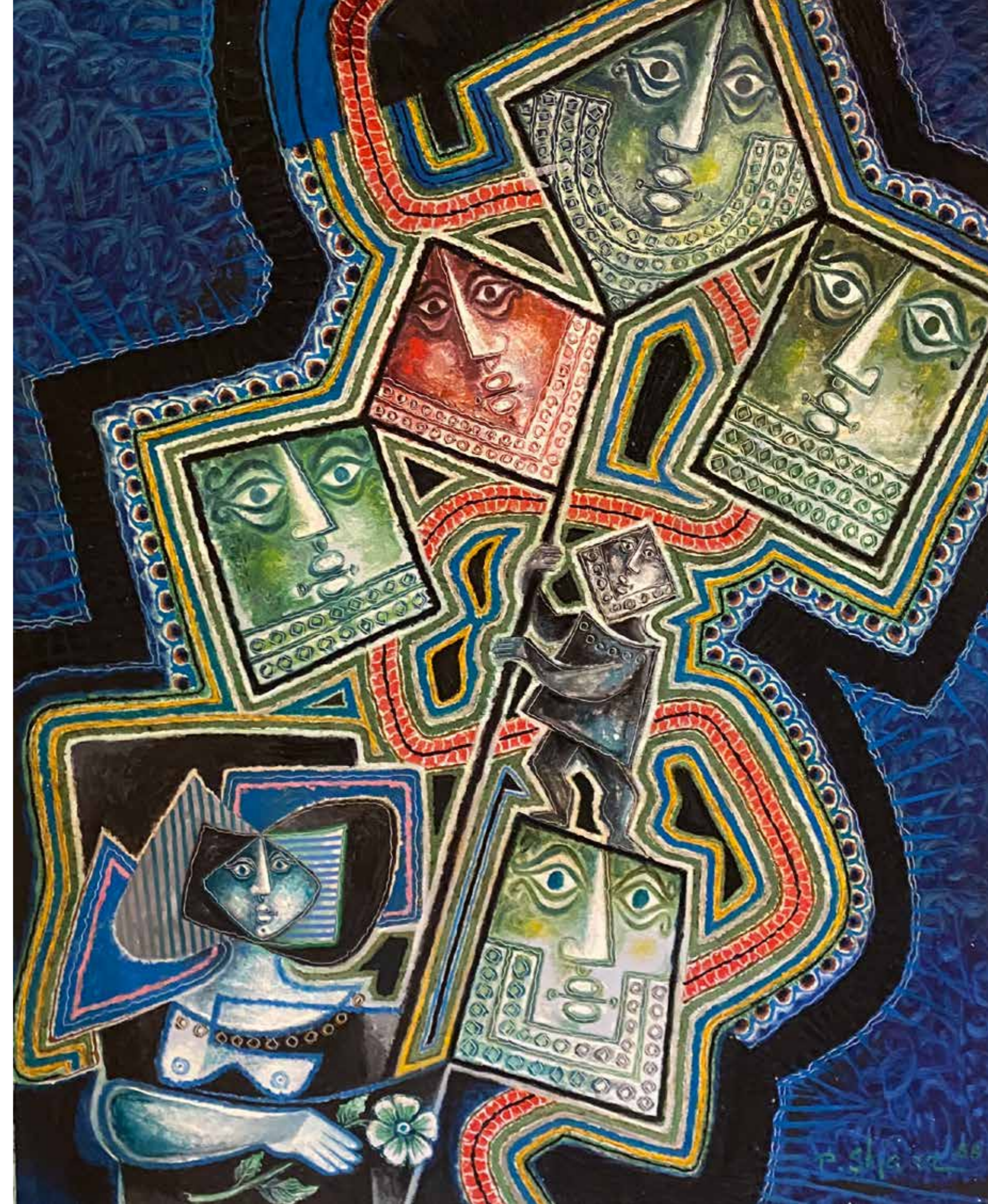
Pinchas Shaar - The Family (150x121 cm)