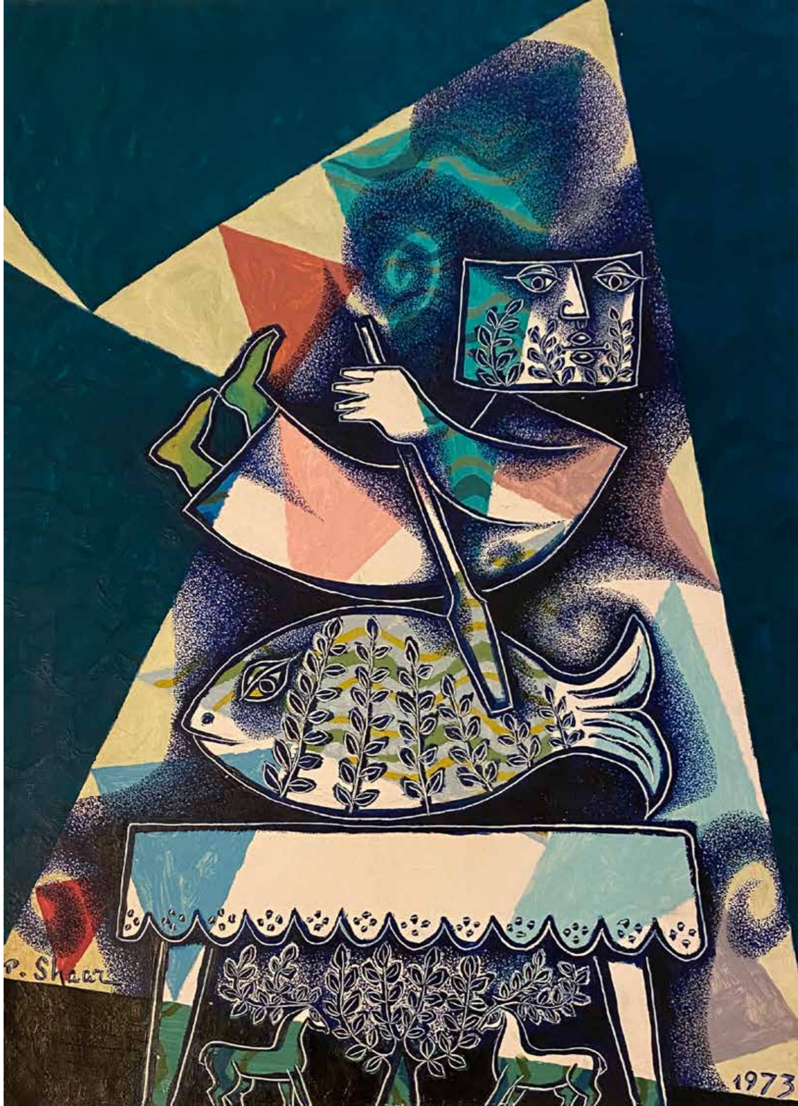
Pinchas Shaar - Jonah the Prophet, 1973 (73x54 cm)