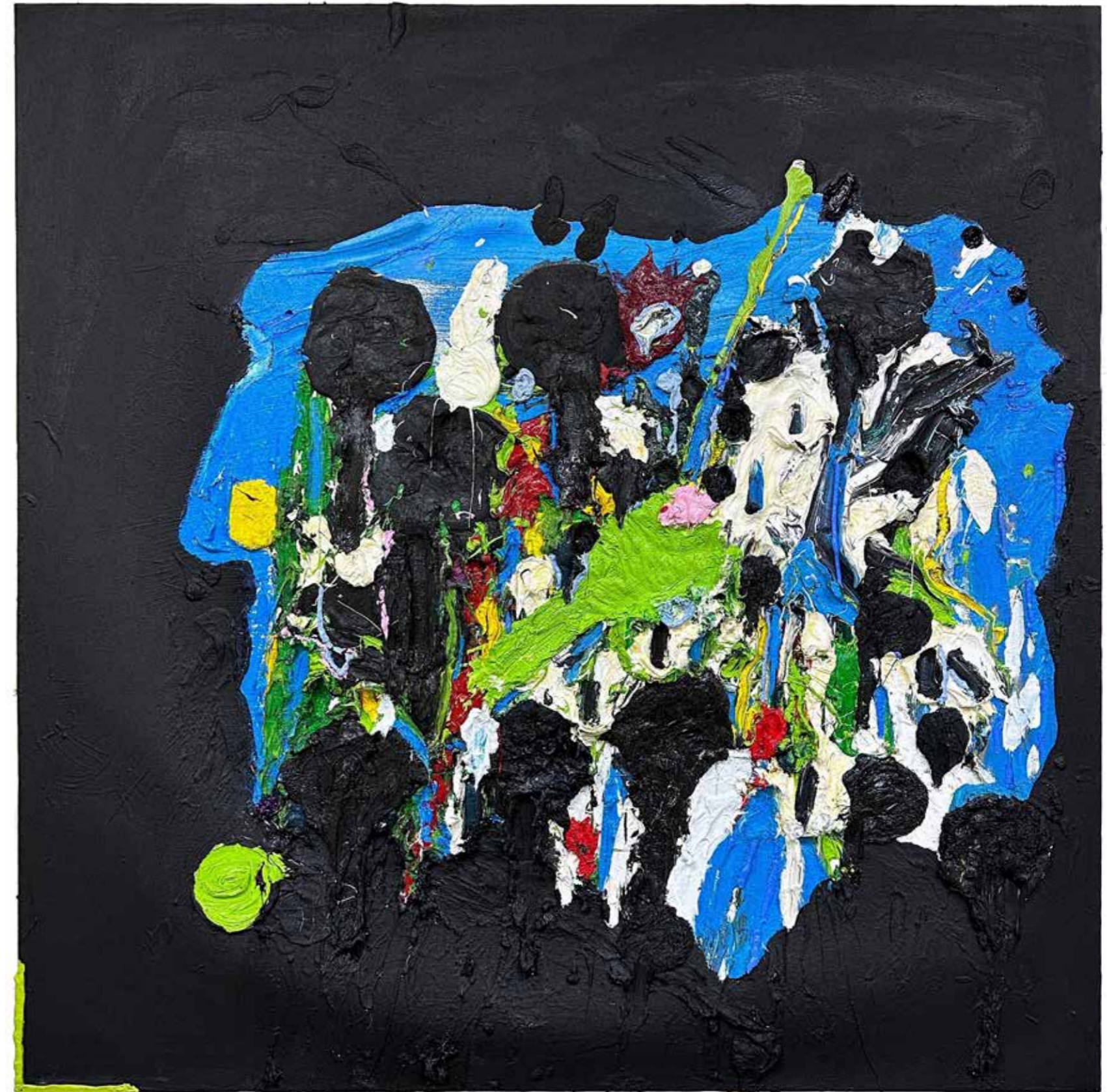
יש את הנוף הזה ויש את הפחד, 2023, שמן על עץ