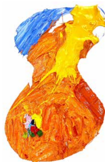
חום יכול להופך אותך צנוע. שמן על עץ