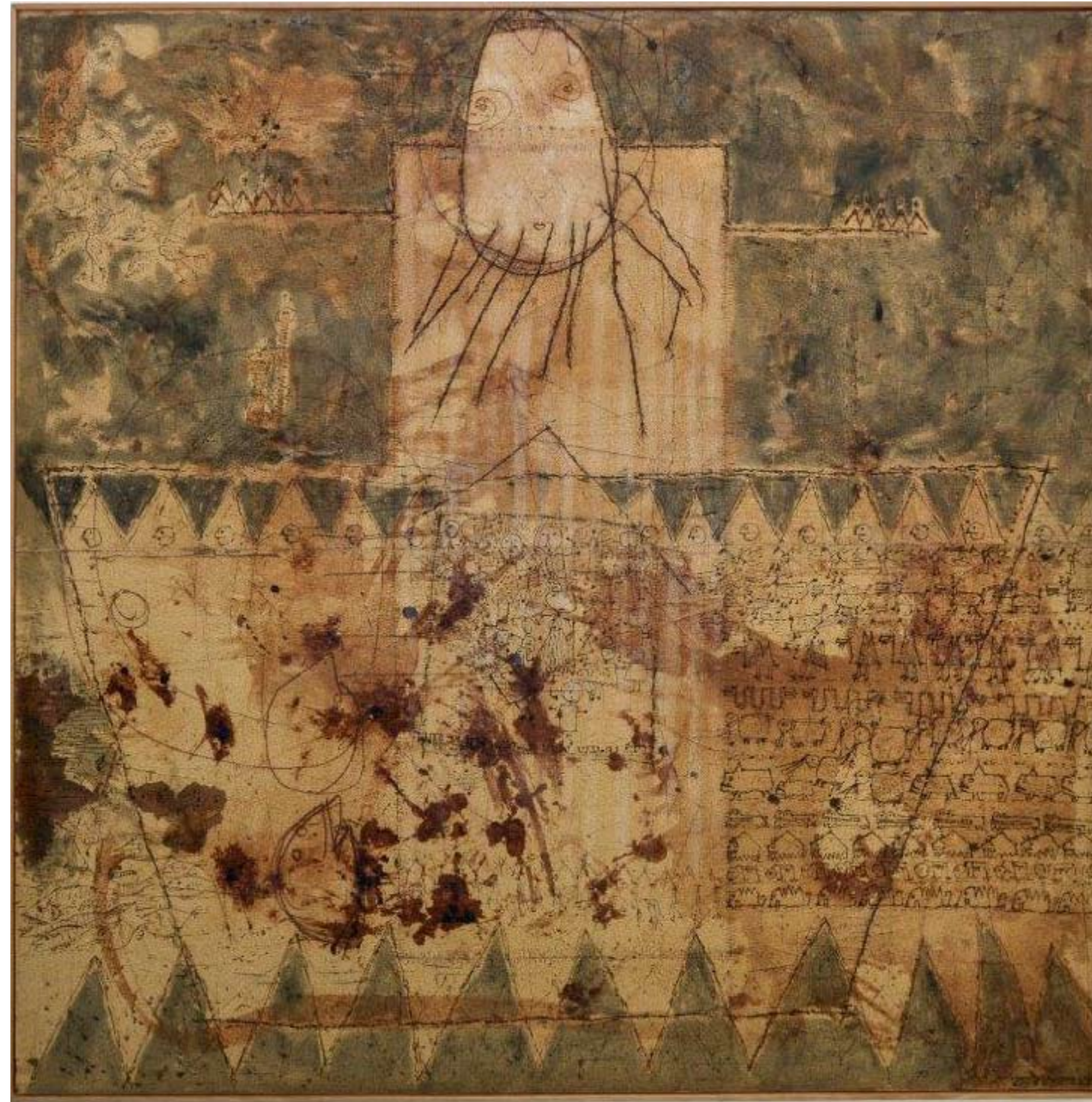
מוזיאון בר דוד