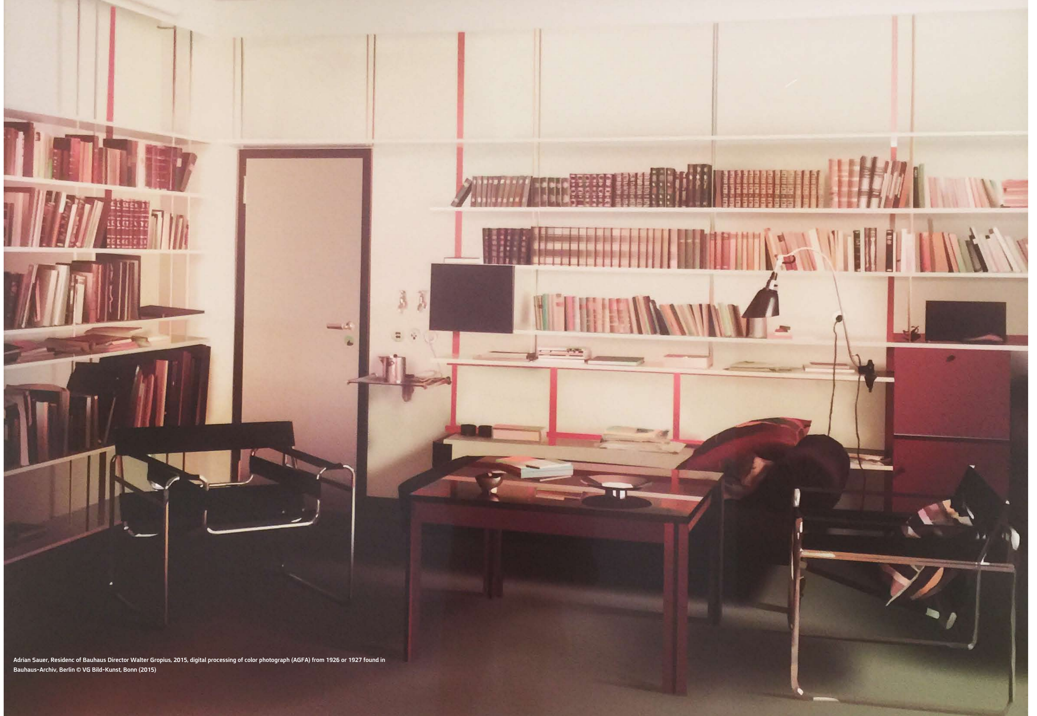
Adrian Sauer, Residence of Bauhaus Director Walter Gropius, 1925, digital processing of color photograph (AGFA) from 1926 or 1927 found in Bauhaus-Archiv, Berlin