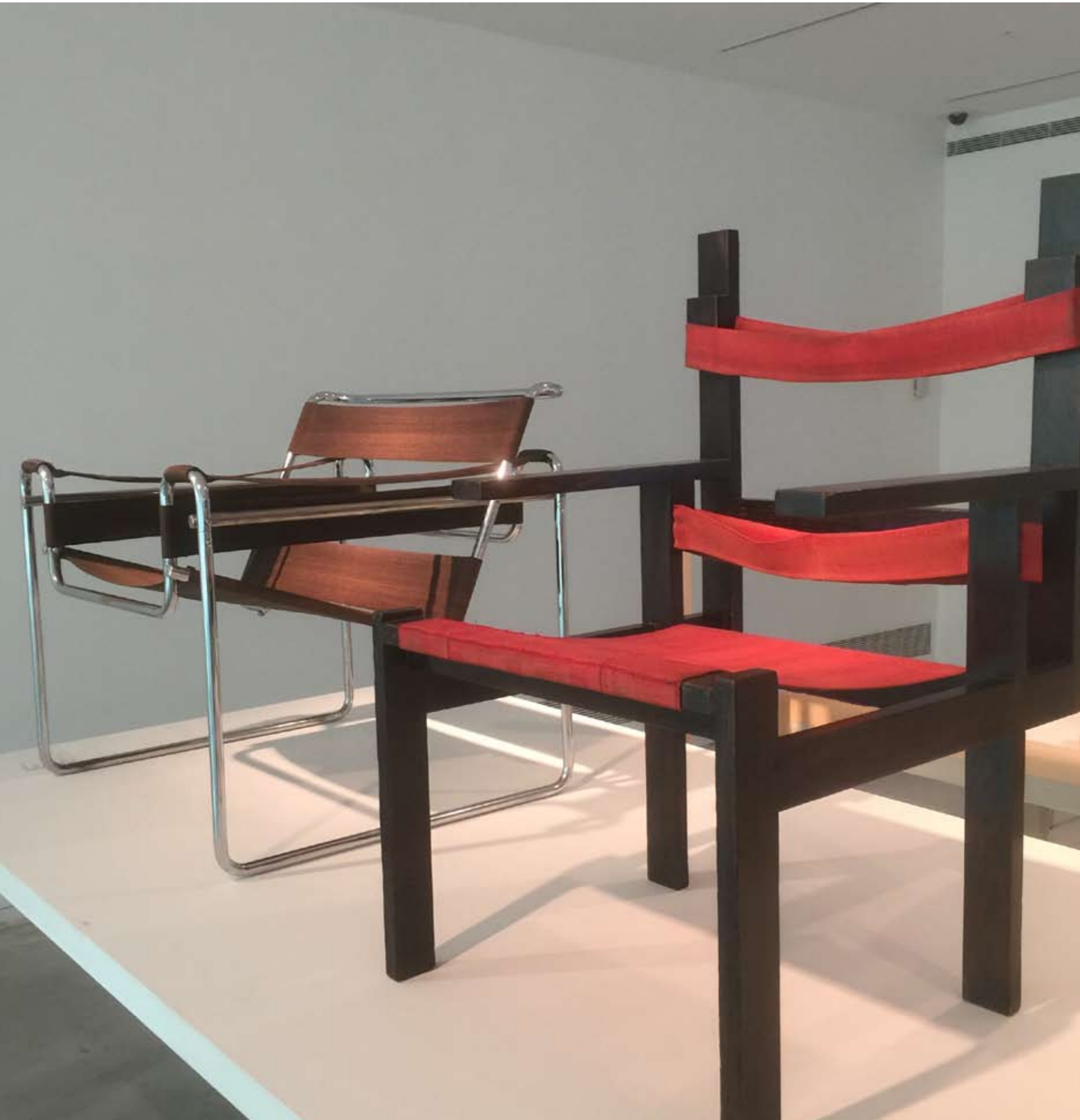
צילומים מתוך התערוכה: חנה ברק אנגל

אוצרת: יולנטה קוגלר- מוזיאון ויטרה לעיצוב אוצרת אחראית: מאירה יגיד-חיימוביץ'