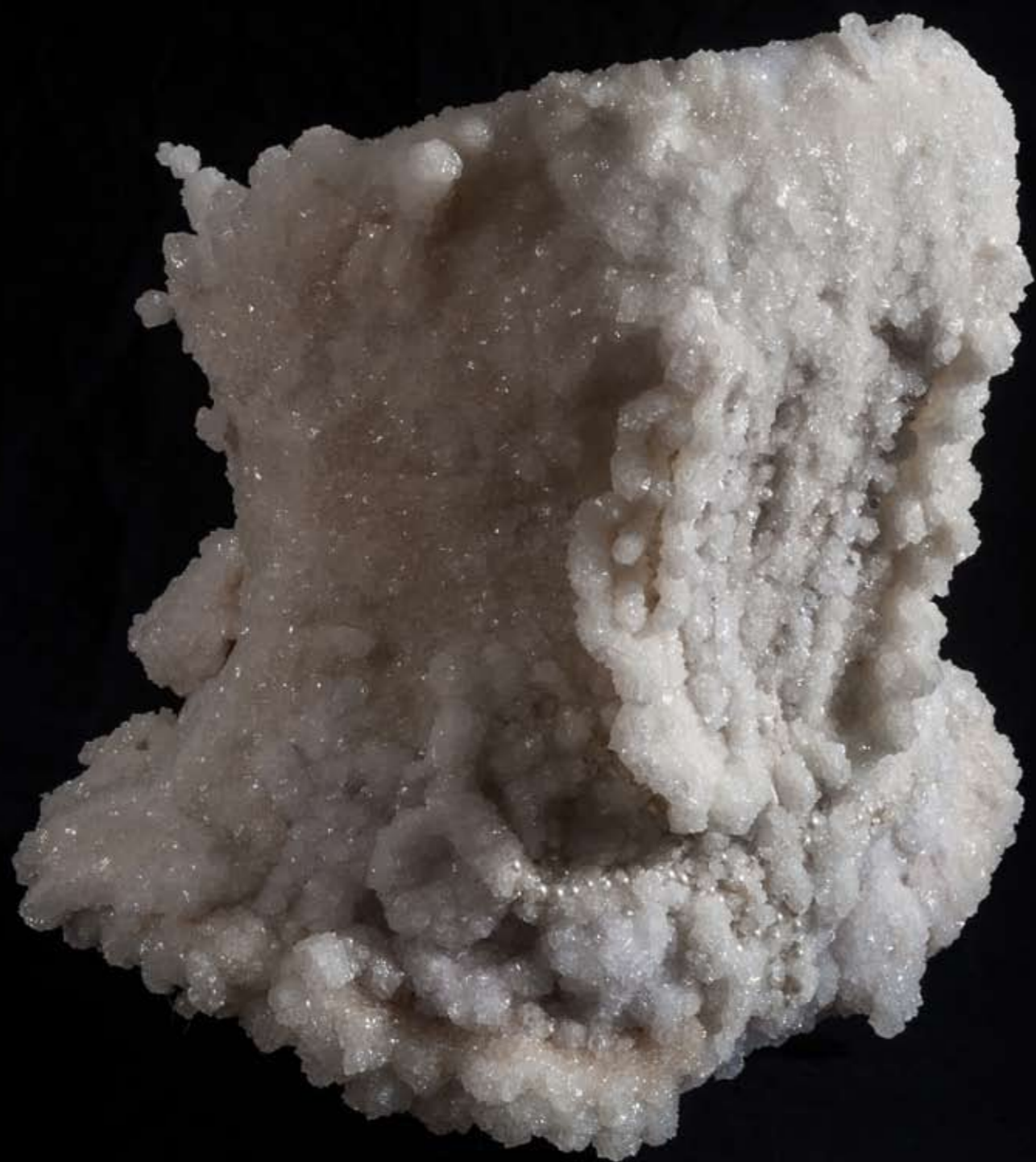
סיגלית לנדאו, WEDDING CREAM, 2013, Synthetic net suspended in the water of the Dead Sea, 35cm x 50cm x 60cm