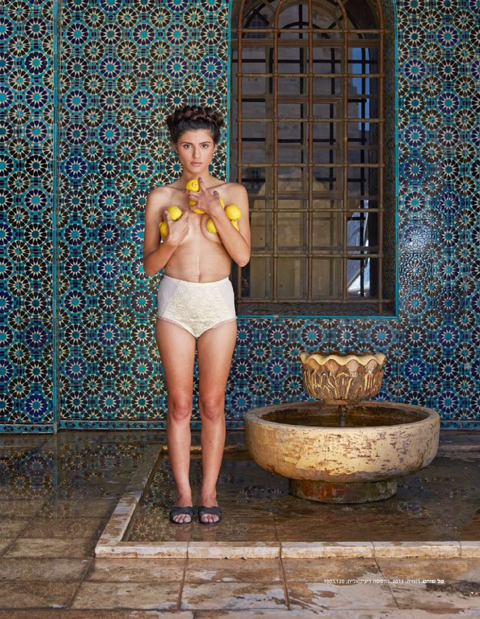
טל שוחט, רומייה, 2013, הדפסה דיגיטלית, 100X120