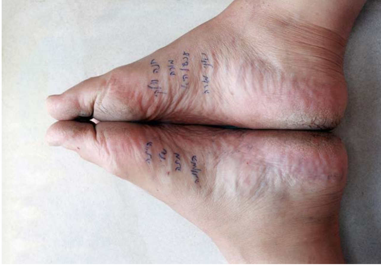
מיכל שמיר, ללא כותרת, הדפסה דיגיטאלית, 40X30