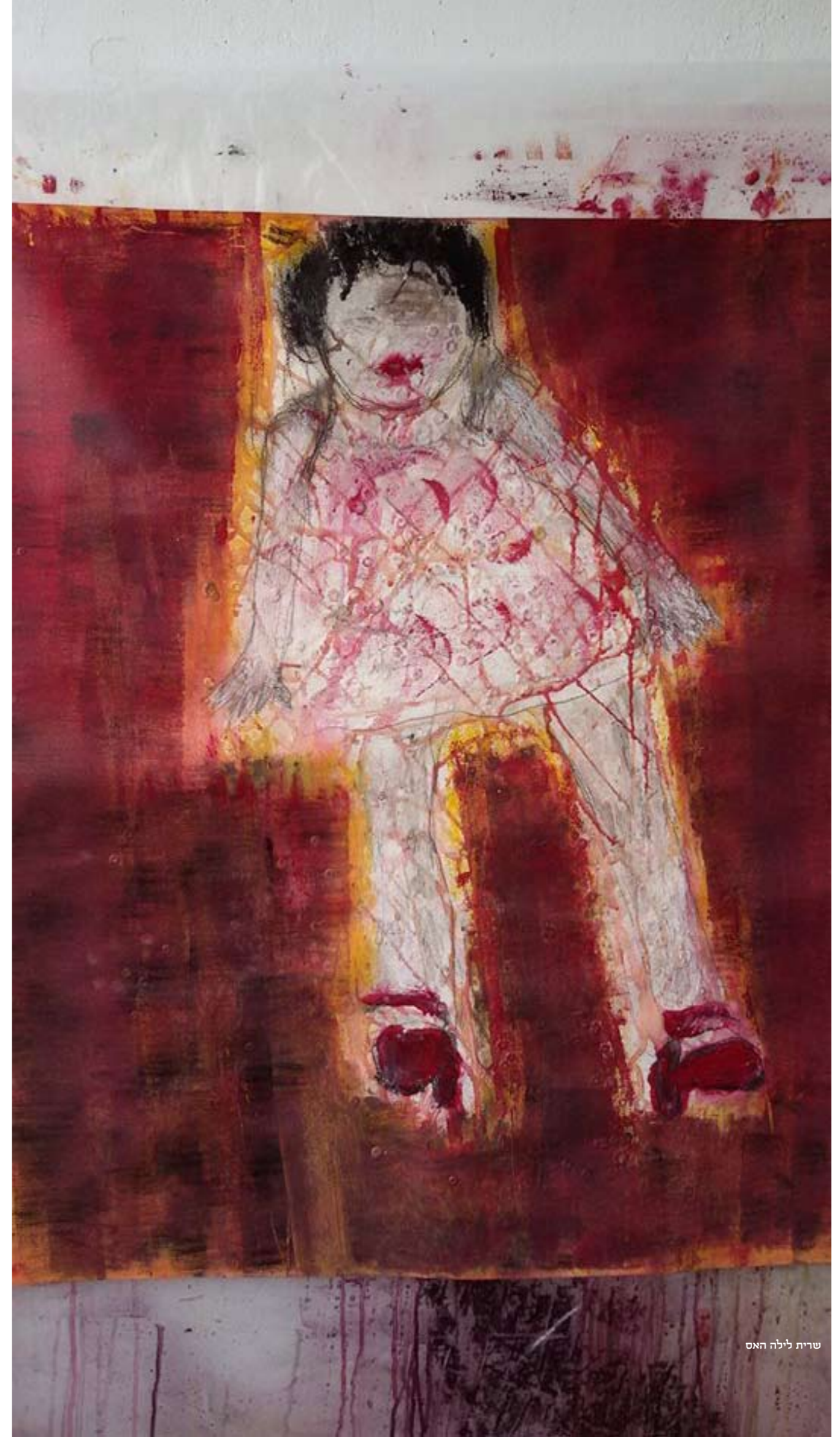
שרית לילה האס