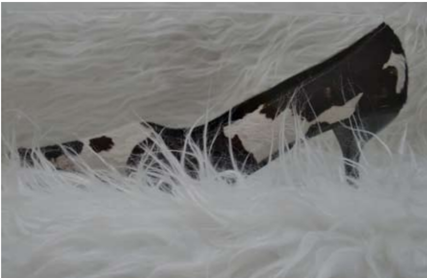
אתי וידר ורצר